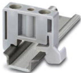
Endhalter, Breite: 6 mm, Farbe: grau

Bitte beachten Sie, dass die hier angegebenen Daten dem Online-Katalog entnommen sind. Die vollständigen Informationen und Daten entnehmen Sie bitte der Anwenderdokumentation. Es gelten die Allgemeinen Nutzungsbedingungen für Internet-Downloads. ( http://phoenixcontact.de/download )