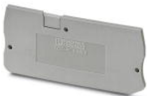
Abbildung zeigt ähnlichen Artikel in grau

Abschlussdeckel, Länge: 76,9 mm, Breite: 0,8 mm, Höhe: 24,3 mm, Farbe: orange